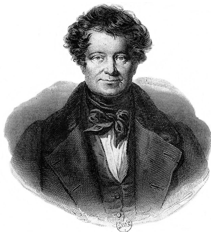
Figure 3 : « Daniel O'Connell »